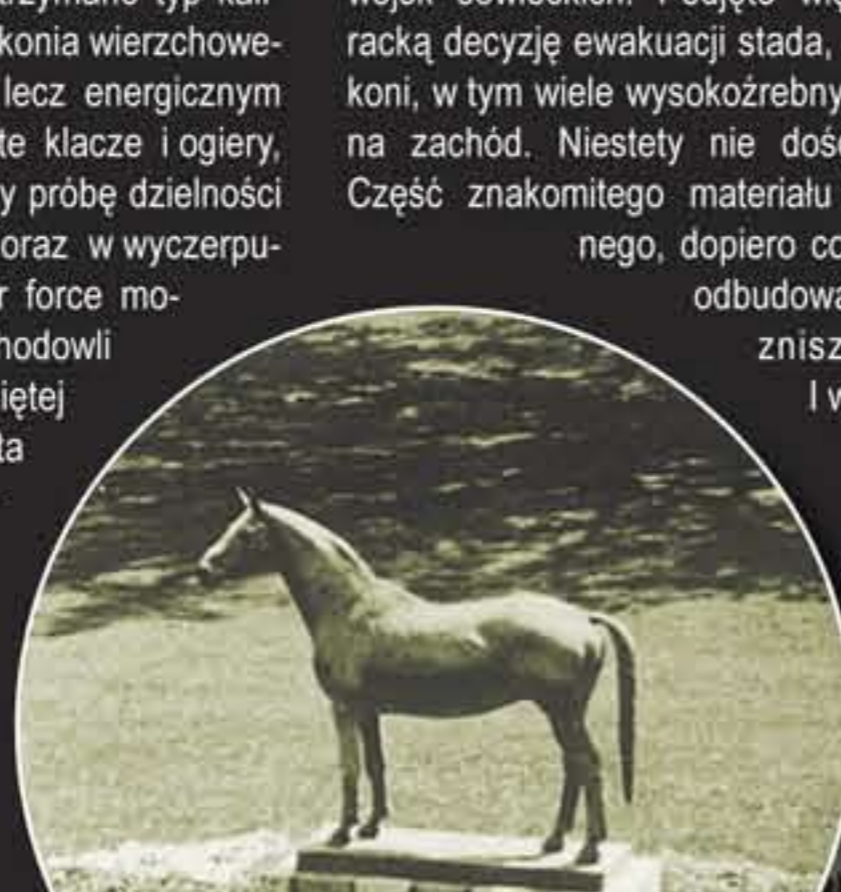
▲ Stadnina w Trakenach – budynek główny a przed nim pomnik ogiera Tempelhuber.

być na zawsze utracona. Wiele z tych koni, które opadły z sił, źrebaki odłączone od matek zostało pozostawionych za uciekającym stadłem, wiele zginęło z wycieńczenia, duża część dostała się w sowieckie ręce. W końcu, po okrazeniu przez oddziały sowieckie na (na wpuł zamrażającym) Zalewie Wiślanym większość koni utopiła się bądź zamarzła pod pękającym lodem... Do Niemiec Zachodnich dotarło jedynie 28 koni urodzonych w stadninie w Trakenach